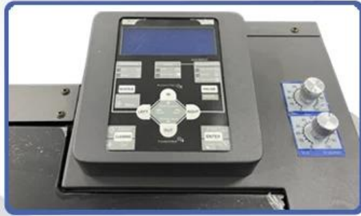
NO.2 Digital Operation Display System