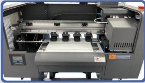
NO.1 Print Head Carriage & Heavy Pressure Roller With Rub