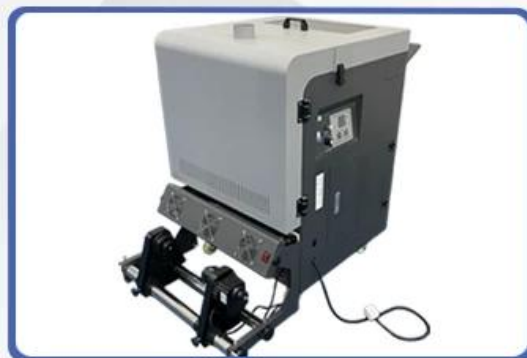
NO.6 DTF Powder Shaker with DTF Film Taking Up System