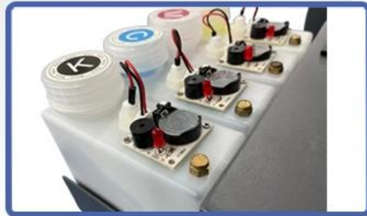
NO.4 Ink Shortage Alarm Device