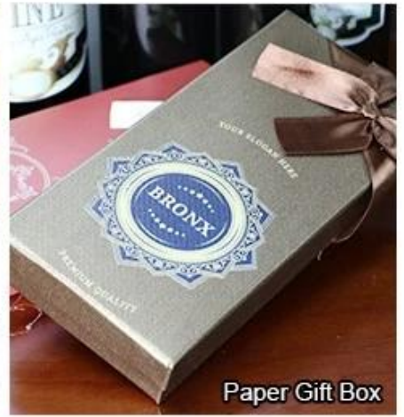
Paper Gift Box