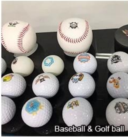
Baseball & Golf ball