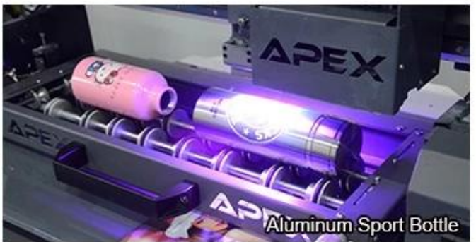
Aluminum Sport Bottle