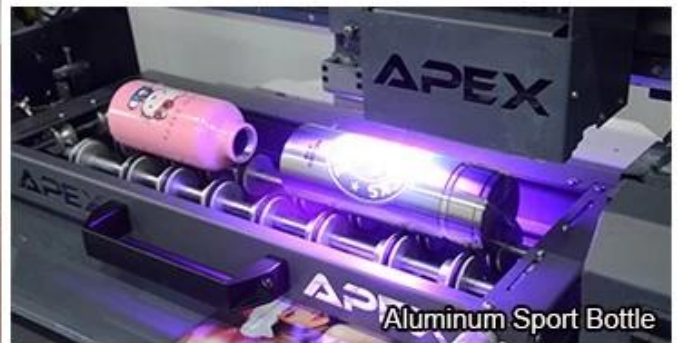
Aluminum Sport Bottle