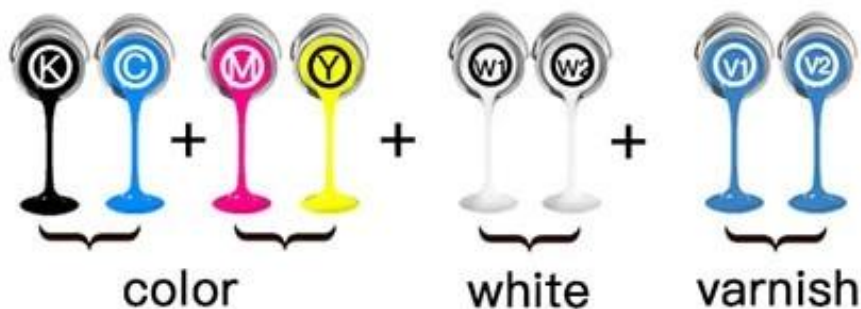
EPSON DX5 Print Heads Arrangement (1pc Head) UV4060/UV6090/N4060/N6090: Single Head 8 Channels