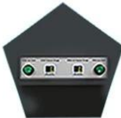
The color separation cleaning device has high washout rate and better ink saving