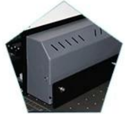
Automatic height detector, ink carriage anti-collision