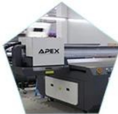
Environmental friendly LED-UV curing