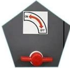
Suction platform segment control