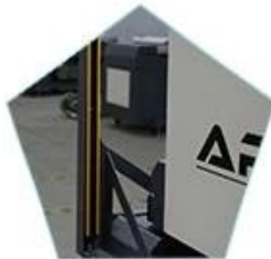
high sensitive printer anti-collision, safe operation