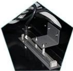
Ink carriage with Anti-static device