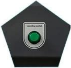
Platform locating function