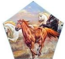
Support CMYK, White and Varnish synchronization output