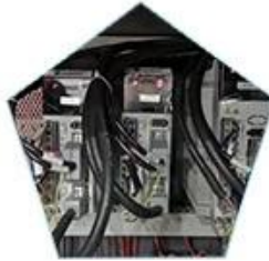
X,Y axis uses three groups of servo